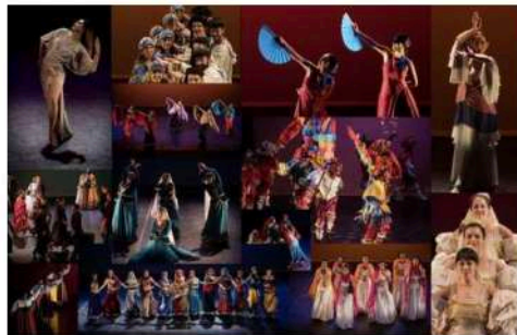
Parte del cartel promocional de la presentación.

Ana Mónica Rodríguez Tiempo de lectura: 3 min.